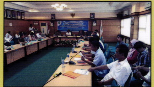
Pertemuan Koordinasi Sinkronisasi Berahi di Kalimantan Timur