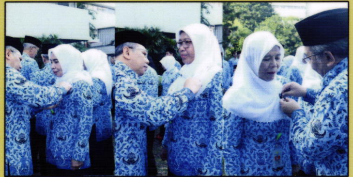
Penerimaan Satyalencana Karya di Jakarta