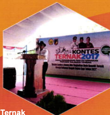
Kontes Ternak di Provinsi Sulteng