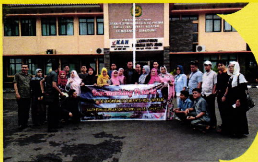
Kunjungan Peserta Diklat PIM Kabupaten Enrekang Prov. Sulsel